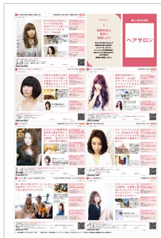
ヘアサロン掲載イメージ