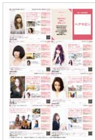
ヘアサロン掲載イメージ